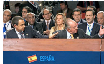
Imagen del ya famoso "¿Por qué no te callas?" del monarca español. "Hace 500 años, el Rey también nos mandó a callar", argumentó Chávez.