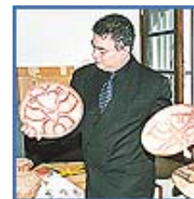
Recuperan piezas prehispanicas

A unque Panamá tiene 168,140 personas analfabetas correspondiente a 7.6%, considerado un bajo nivel en comparación con otros países de área centroamericana, la Dirección Nacional de Educación de Jóvenes y Adultos del Ministerio de Educación, continúa con su lucha para sacar a más panameños del mundo de la ignorancia.