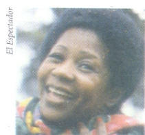
Leonor González Mina