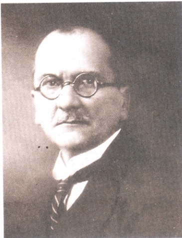
Miguel Abadía Méndez

ganga (1997); Música y danzas regionales (2001), entre otras. Coautor, con Jaime Bermúdez Silva, de Algunos cantos nativos tradicionales de la región de Guapi (Cauca) y Aires musicales de los indios guambianos del Cauca (1970). Ver COMPENDIO GENERAL DE FOLKLORE COLOMBIANO.