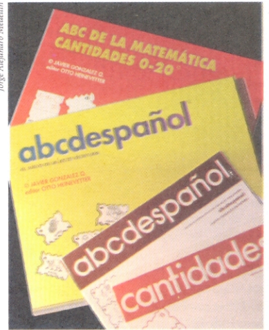
Abcdespañol Javier González Quintero

ABELLO ROCA, ANTONIO (Barranquilla) Político. Casado con Yolanda Vives (cinco hijos). Columnista del diario El Herald; gobernador de Atlántico (1971-73); ministro de Comunicaciones (1981) en el gob. de Turbay Ayala.